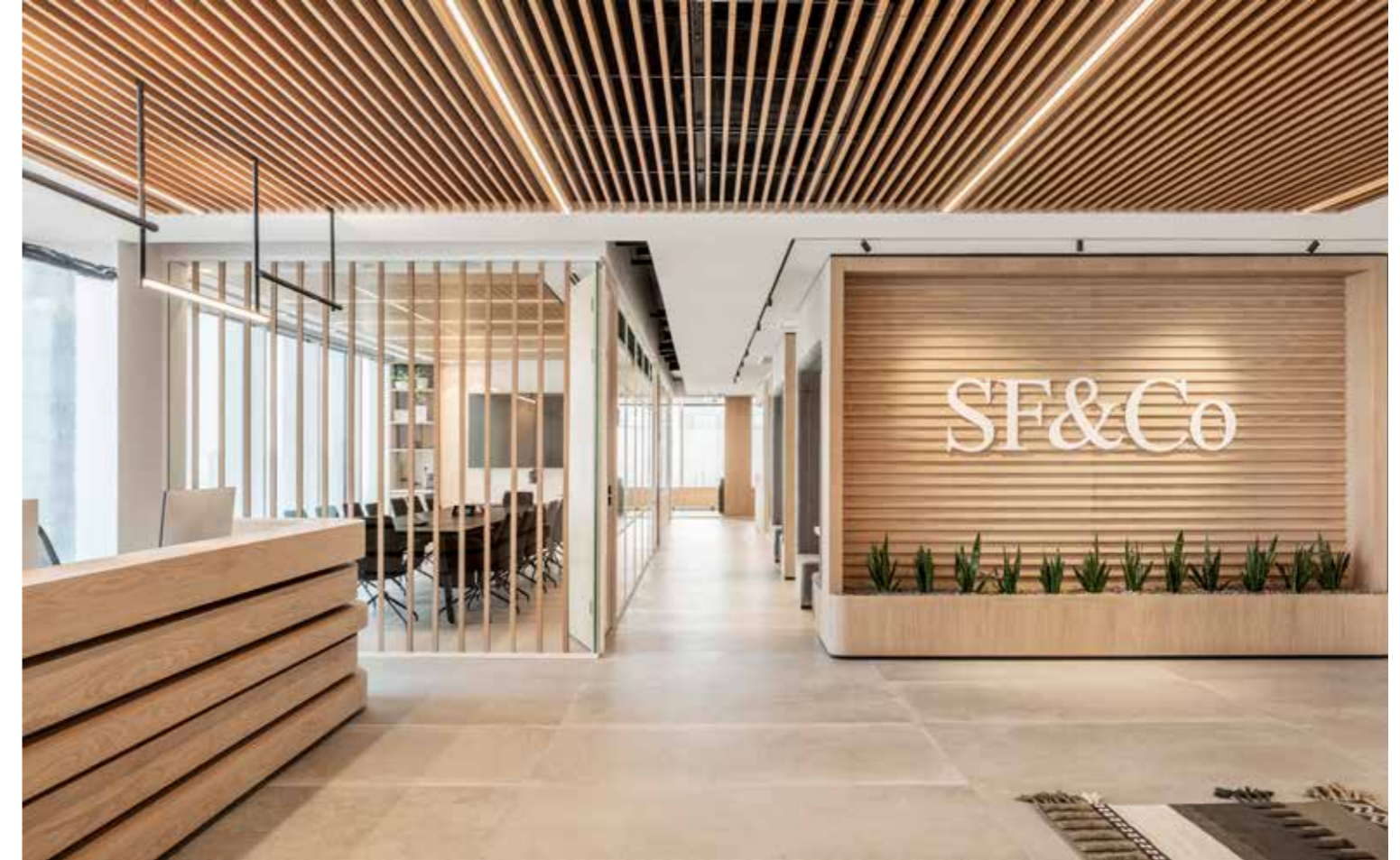
[ משרדים ומסחר ]