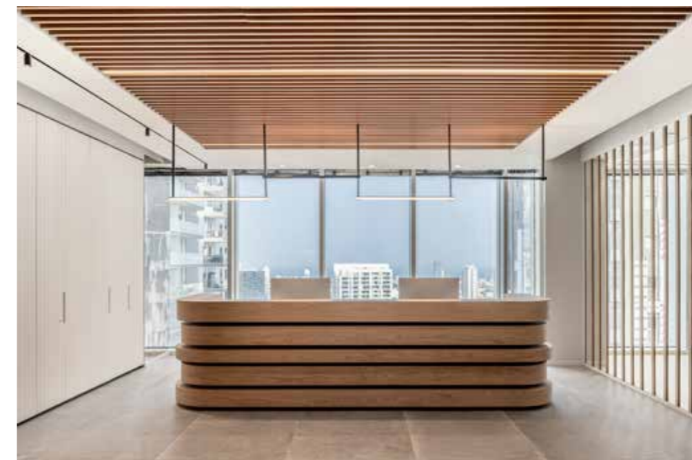
למעלה: חלל כניסה למטה: קבלה

הקונספט העיצובי בעיצוב המשרדים, משחק עם פטרונים וטקסטורות דו ותלת ממדיות. החלל מקבל חיים על ידי שימוש בקווים ליניאריים, שמקבלים ביטוי באופנים רבים – בחלוקות של המחיצות, בטקסטורה של הזכוכיות, בעיצוב דלפק הקבלה ואפילו בעיצוב הבוטים. אחד האתגרים העיצוביים היה להתמודד עם מסדרונות ארוכים ומתמשכים ועל כן "פירקה" המעצבת את רצף חזיתות החדרים, כדי לייצר מקצבים לא אחידים וייצרה איים של צמחיה, הבולטים ממישור החזית ושוברים את רצף ההליכה ואת תחושת המסדרון האינסופית ■